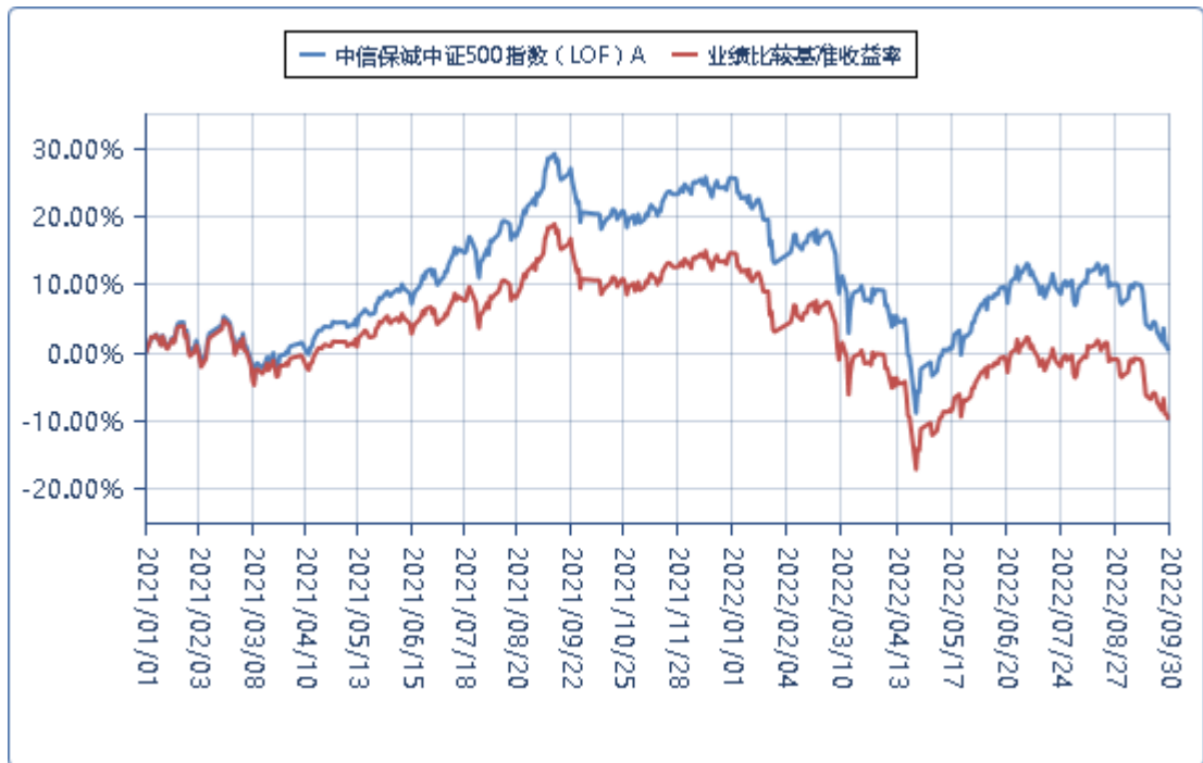
中信保诚中证 500 指数 (LOF) C