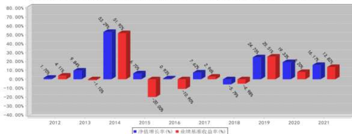
兴全可转债混合基金每年净值增长率与同期业绩比较基准收益率的对比图（2021年12月31日）