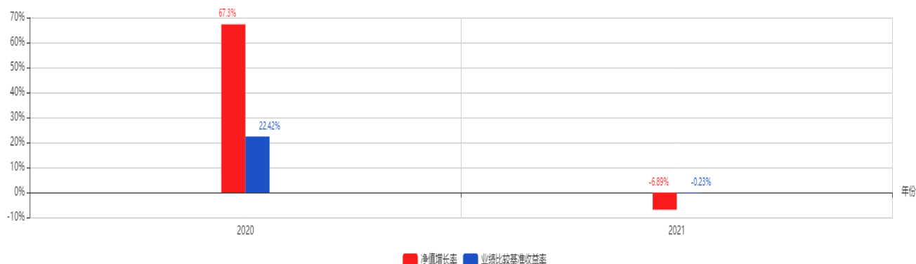
基金每年的净值增长率及与同期业绩比较基准的比较图

注：业绩表现截止日期 2021 年 12 月 31 日。基金过往业绩不代表未来表现。