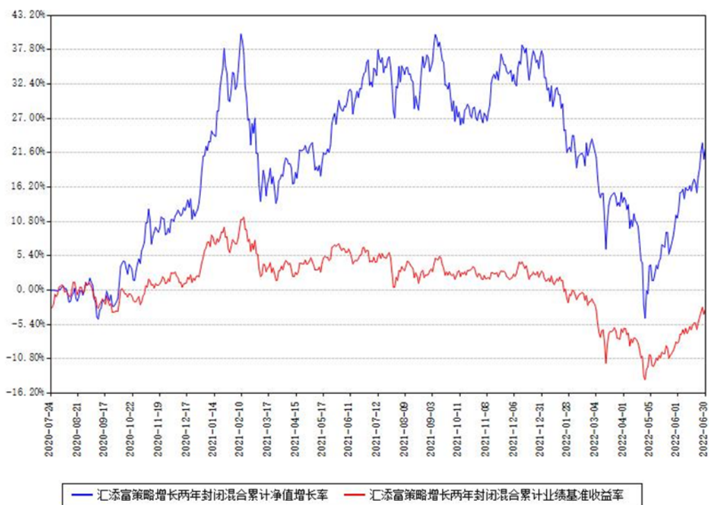
汇添富策略增长两年封闭混合累计净值增长率与同期业绩基准收益率对比图