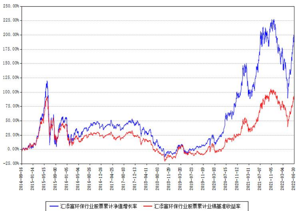
汇添富环保行业股票累计净值增长率与同期业绩基准收益率对比图