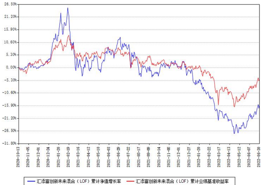
汇添富创新未来混合（LOF）累计净值增长率与同期业绩基准收益率对比图