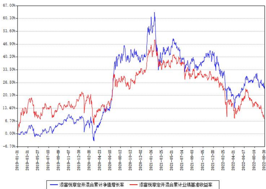
添富悦享定开混合累计净值增长率与同期业绩基准收益率对比图