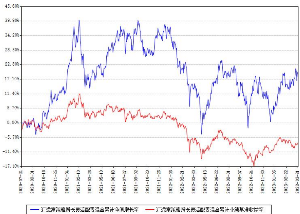
汇添富策略增长灵活配置混合累计净值增长率与同期业绩基准收益率对比图