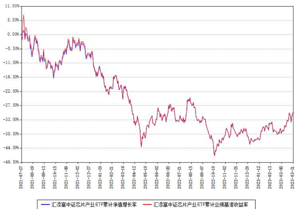
汇添富中证芯片产业ETF累计净值增长率与同期业绩基准收益率对比图