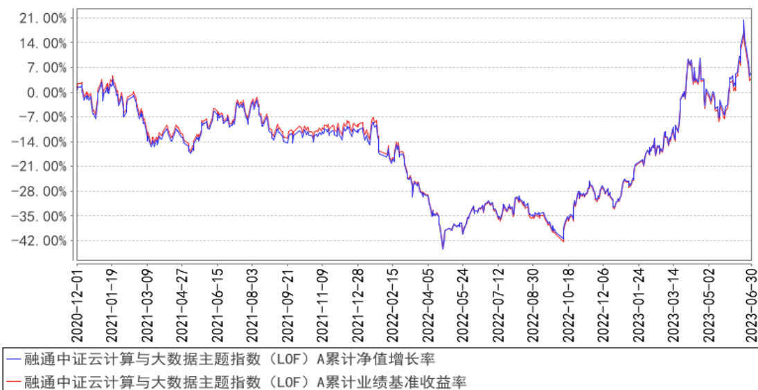
融通中证云计算与大数据主题指数（LOF）A 累计净值增长率与同期业绩比较基准收益率的历史走势对比图