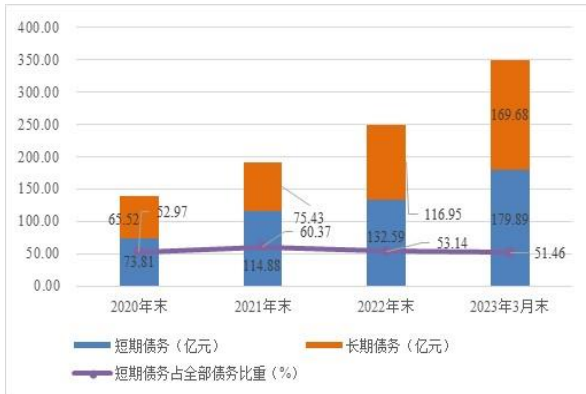
图 2 2020—2022 年末及 2023 年 3 月末公司债务结构