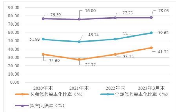
图 3 2020—2022 年末及 2023 年 3 月末公司债务杠杆