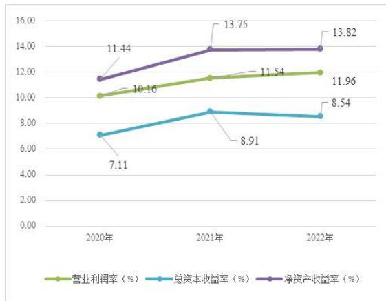
图 4 2020—2022 年公司盈利指标