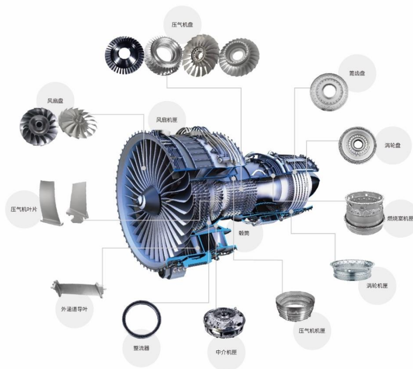
公司航空发动机零部件产品示意图