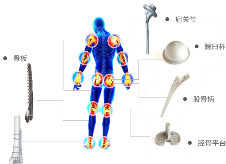
公司医疗骨科关节植入锻件产品示意图

公司医疗关节植入锻件是骨科人工关节的半成品工件，客户采购后进行一系列加工及人体植入适应性医疗表面处理，最终形成能植入于人体的医疗骨科关节。由于医疗骨科植入锻件与航空发动机精锻叶片在材料及锻造环节的生产设备、工艺流程上相近，因此，公司依托先进的航空锻造技术与工程实力进入医疗骨科植入物锻件领域，主要产品包括人工髋关节-股骨头、人工髋关节-髋臼杯、人工膝关节-胫骨托以及人工创伤类-骨板等。