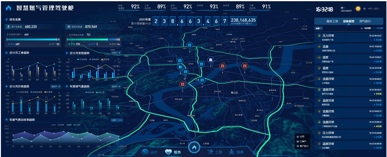
智慧燃气管理驾驶舱