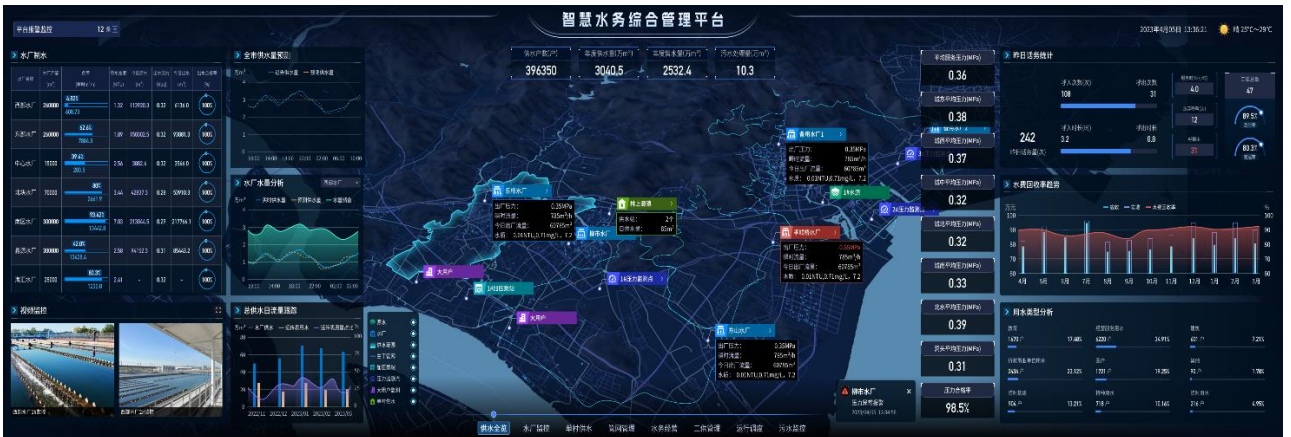
智慧水务综合管理平台

公司数字水务解决方案同样采用云-管-端的服务架构，涵盖水务场景下的智能终端感知、智能网络传输、智能数据采集和智慧业务运营，并一直延伸到 C 端用户的智慧服务。目前公司已经开发了各类民用和工商业智能水务终端，利用机电转换、超声传感和电磁传感等技术产生业务源数据，通过NB-IoT网络将海量业务数据汇集于IoT大数据平台，用于水务企业客户服务、运行调度、漏损治理、数据驾驶舱等各项应用功能。目前数字水务整体解决方案主要包含数字水务一体化整体解决方案、DMA分区漏损控制解决方案、二次供水综合解决方案、农饮水一体化整体解决方案，助力水务企业更高效运营、更科学管理、更优质服务。