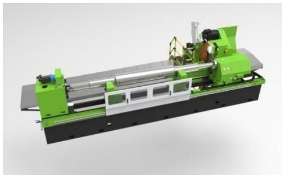
有色金属行业轧辊磨床