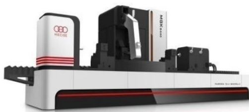
机械加工行业轧辊磨床