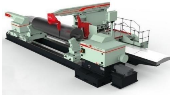
造纸轻纺行业轧辊磨床