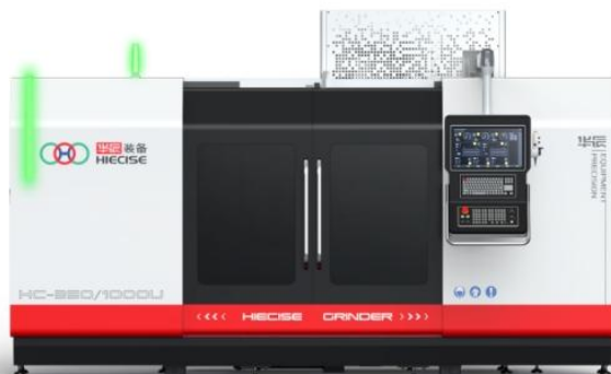
内外圆复合磨床（亚 \mu 磨削中心）

内外圆复合磨床（亚 \mu 磨削系列产品）属于高精度数控万能复合磨床，是公司近期重点推出的高精度、多功能、复合型转塔式数控磨削装备，具有外圆、内圆、非圆、螺纹磨削功能。目前已形成完整的产品体系，标准产品可同时配置 2 片外圆砂轮、1 片内圆砂轮，最多可同时配置 4 片外圆砂轮。公司根据下游客户的功能需求进行柔性化配置，可以满足不同用户的多种精密磨削需求。产品主要面向航空航天、工程机械、工业母机、汽车零部件、刀具、模具、量具液压泵阀、精密电动机等国家重点行业领域，具备外圆、外端面、外锥面、内圆、内端面、内锥面、非圆、螺纹等复杂特征的轴类、套类、盘类等关键核心零件，只需一次装夹即可完成全部复合精密磨削加工工序。夹持磨削圆度最高可达 0.2 微米，圆柱度（长度 1000mm 试件）最高可达 1 微米。