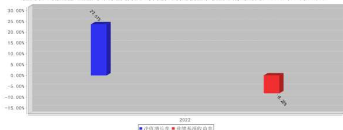
鑫元长三角混合A基金每年净值增长率与同期业绩比较基准收益率的对比图（2022年12月31日）

注：1. 业绩表现截止日期 2022 年 12 月 31 日。基金过往业绩不代表未来表现。