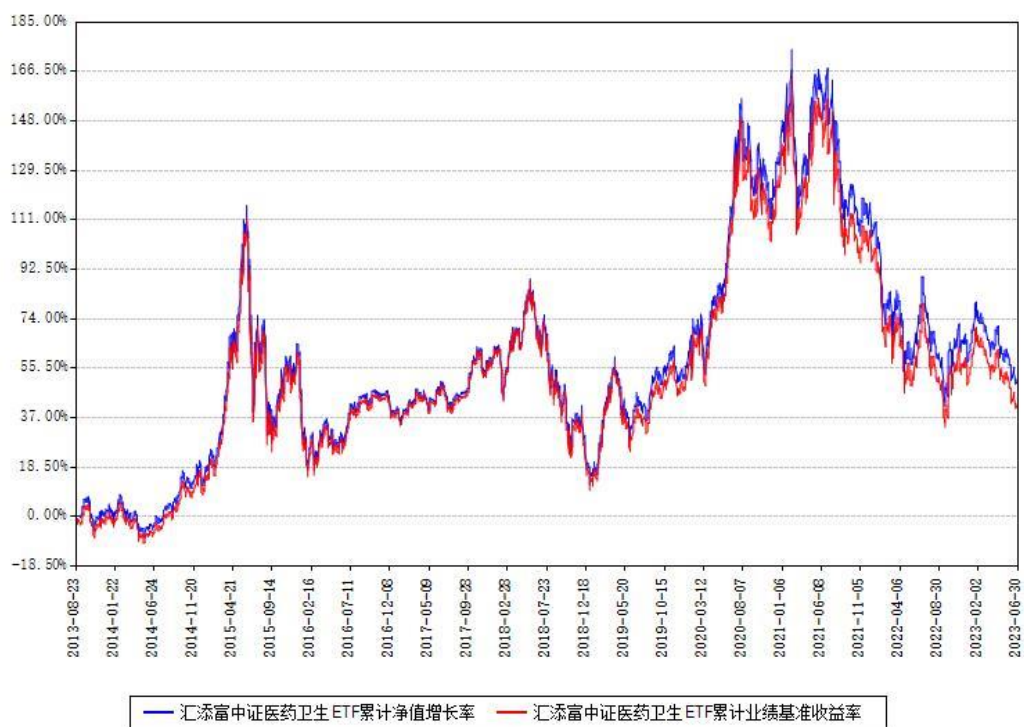
汇添富中证医药卫生ETF累计净值增长率与同期业绩基准收益率对比图