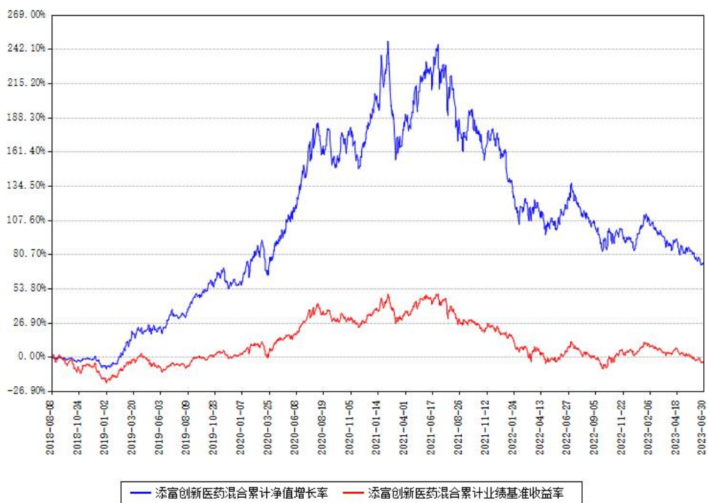
添富创新医药混合累计净值增长率与同期业绩基准收益率对比图