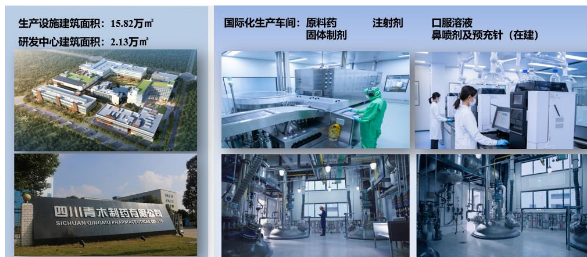
图 2 国际化制造基地图例

公司按照 FDAcGMP 及欧盟 EUGMP 标准建立的高端制剂国际化产业基地一期工程已建设完成并投入运行，注射剂、固体制剂（片剂、胶囊剂）、口服液（口服溶液剂、混悬剂）5 种剂型的生产线已获得《药品生产许可证》。目前公司共有 3 个制造中心，包括 2 个国际化制造基地，公司正在加快推进国际化产业基地二期工程鼻喷剂及预充针平台建设，以进一步加快公司国际化业务进程。