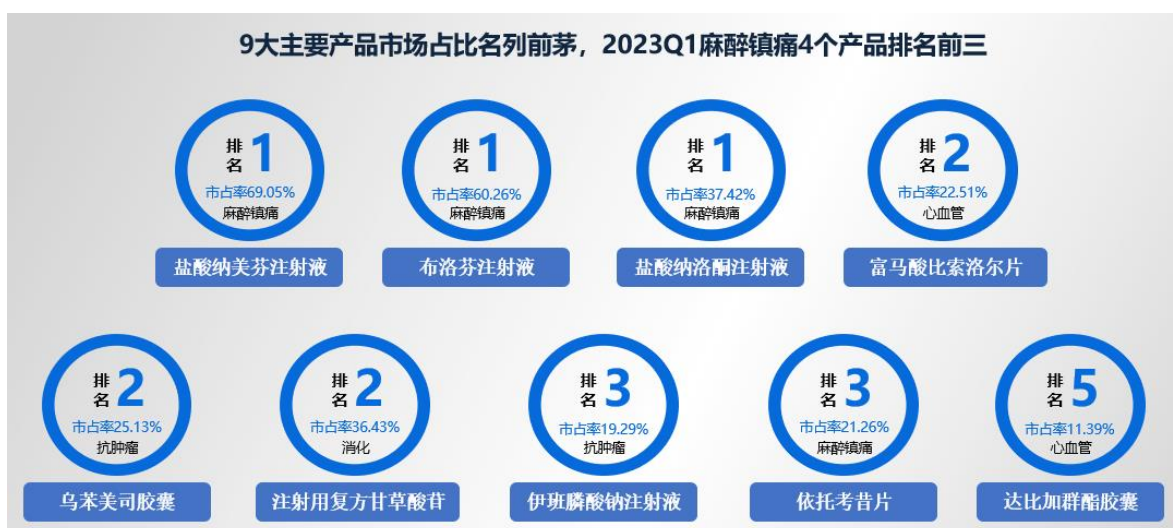
图 1 9 大主要产品市场占有率图例

根据米内网全国重点省市公立医院数据库 2023Q1 数据，公司 9 个主要产品市场占比名列前茅，麻醉镇痛领域 4 个产品排名前三，具体如下：