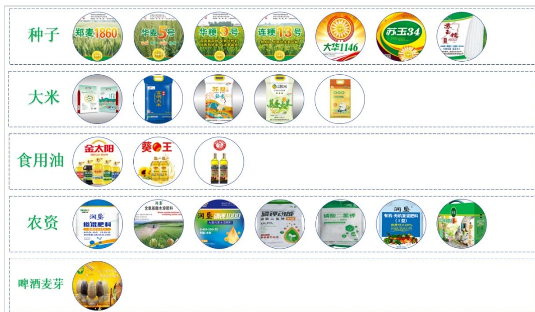
图 3：公司主要产品（部分）

公司旗下全资或控股子公司经营的产品主要包括稻麦原粮、种子、大米、食用油、农资等。报告期内，公司从事的主营业务未发生重大变化，主要产品（及代表品牌）如下：