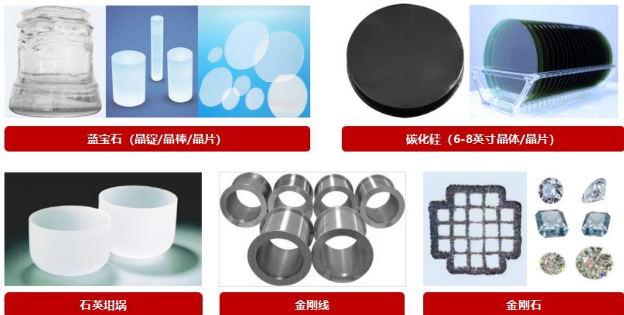
图五 公司材料业务产品