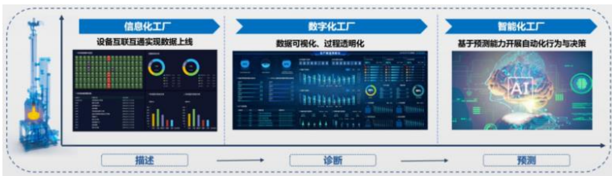
图四 公司智能化解决方案

同时，以材料生产及加工装备链为主线，通过实现各装备间的数字化和智能化联通，向客户提供自动化+数字化+AI大数据的解决方案：