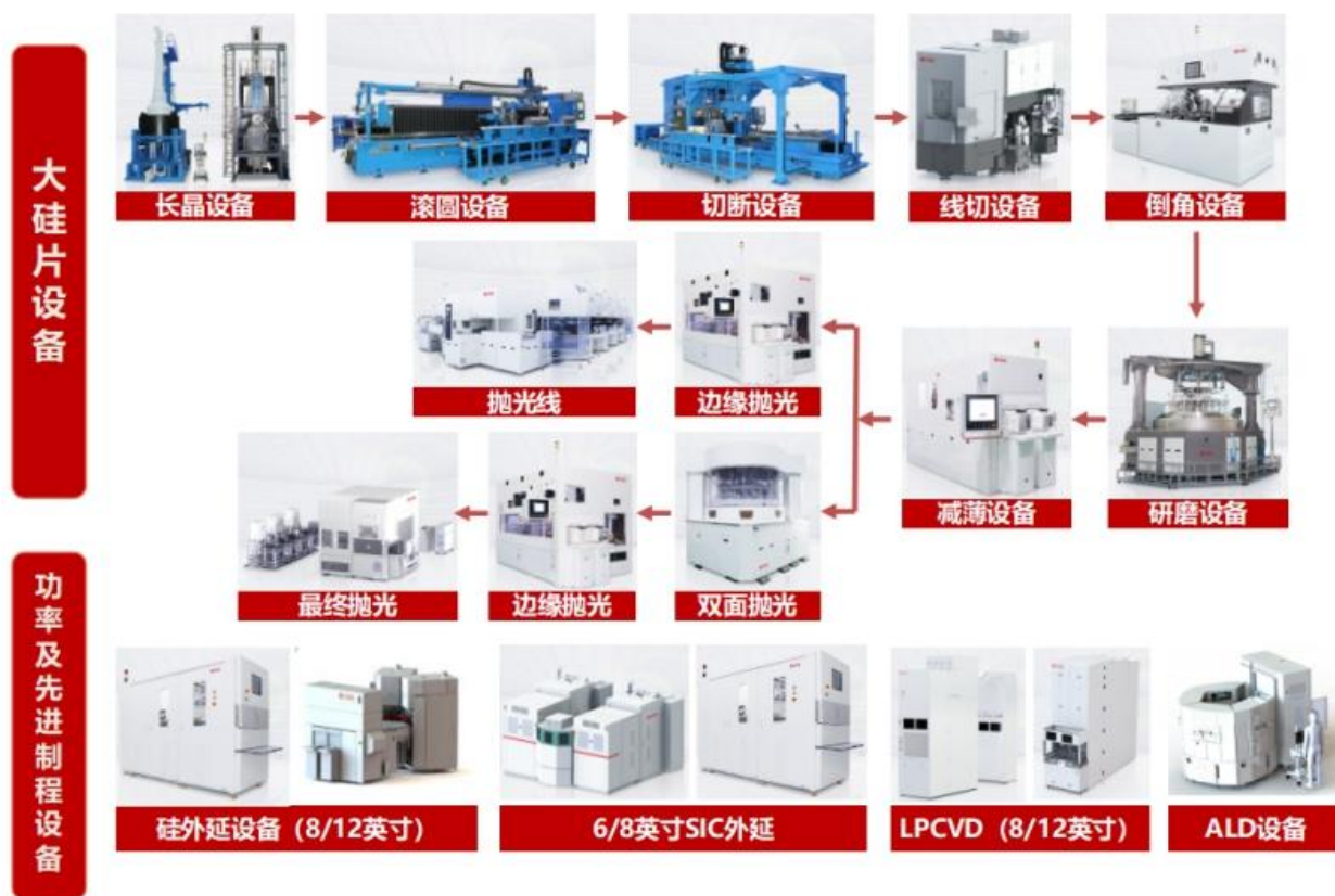
图二 公司半导体装备产品

截至目前，公司已基本实现 8-12 英寸大硅片设备的全覆盖并批量销售，6 英寸碳化硅外延设备实现批量销售且订单量快速增长，8 英寸碳化硅外延设备处于验证中，相关产品质量达到国际先进水平。