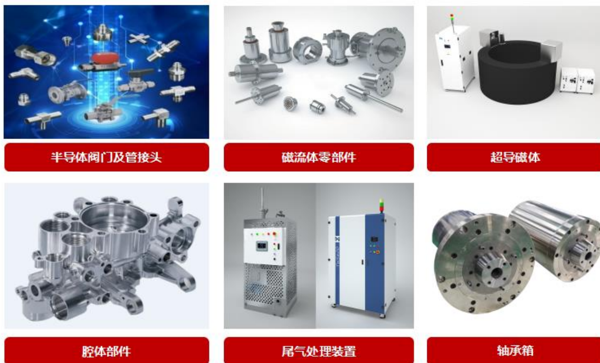
图六 公司精密零部件

公司还建立了以超导磁体、半导体阀门、管件、磁流体等精密零部件产品体系，以配套半导体和光伏设备所需关键零部件及需求，保障供应链的稳定和安全。