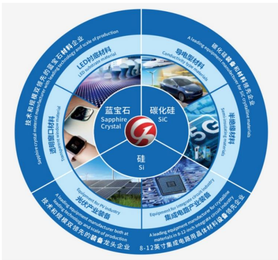
图一 公司主营业务布局

公司逐步确立了先进材料、先进装备双引擎可持续发展的战略定位，形成了装备+材料协同发展的良性产业布局，并以材料生产及加工装备链为主线，实现各装备间的数字化和智能化联通，向客户提供自动化+数字化+AI 大数据的整体智能工厂解决方案。