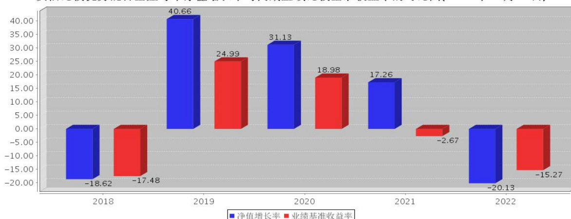
安信比较优势混合基金每年净值增长率与同期业绩比较基准收益率的对比图(2022年12月31日)

注:基金合同生效当年期间的相关数据按实际存续期计算。基金的过往业绩并不代表其未来表现。