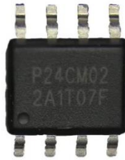
图：公司 EEPROM 产品

公司已形成覆盖 2Kbit 到 4Mbit 容量的 EEPROM 产品系列，操作电压覆盖 1.2V-5.5V，主要采用 130nm 工艺制程，具有高可靠性、面积小、性价比高等优势，同时实现了分区域保护、地址编程等功能，可对芯片中存储的参数数据进行保护，避免数据丢失和篡改，可擦写次数可达到 400 万次，数据保持时间可达 200 年。公司部分中大容量产品采用 95nm 及以下工艺制程下并已实现量产。