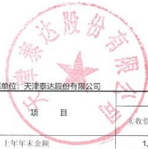
股东权益变动表（续）