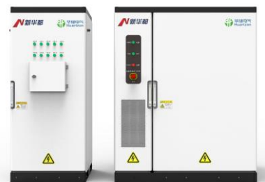
工商业储能一体机

交流升压一体舱产品由高压室、低压室、变压器、变流器 PCS 四部分组成的箱变结构，主要应用于新能源发电侧的交直流转换，功率控制和升压并网等功能；变压器室设计，根据变压器的结构形式的不同，分为浇注干式变压器（舱体内部放置）和油浸式变压器（舱体外部放置）两种；高压室为系统的输入进线部分，负责发电设备和电网的连接和保护切断，低压室内置低压辅助电源、二次电气和控制部分；变流器 PCS 作为系统核心功率变换的组件，高防护等级，可直接在一体舱撬装底座上外露安装。