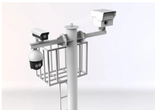
变电站预警应用·电力现场作业安全预警系统

基于三维实景的变电站作业 AI 安全预警系统 根据变电站现场作业工作票要求, 将变电站作业监管区域、设备、作业行为等全息数据化, 建立实景三维模型。利用远距离激光三维扫描感知设备采集作业区人员、工具、登高车辆、部件等空间点云数据和图像数据, 经人工智能分析判断, 实时识别预警作业区域内人员准入备案、安全帽佩戴、工作服规范穿着、跨越安全围栏、梯子搬运、工完场清、登高人员使用安全带等作业违章和不规范行为。