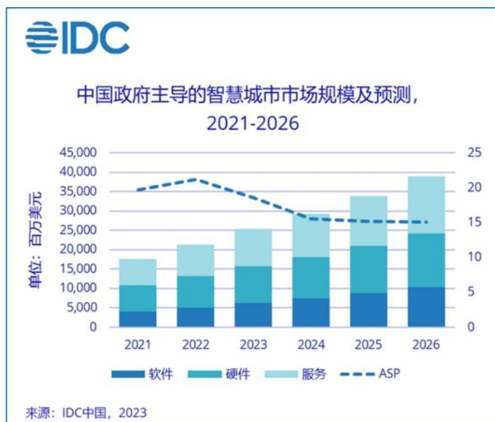
图表：IDC 对中国智慧城市市场规模的预测

智慧城市的出现和建设发展顺应了国内政策、社会、技术和实践背景。从增速看，IDC 预计 2020-2024 年全球智慧城市市场 CAGR 为 13.7%，而 2020 年中国总支出同比增长 12.0%，未来五年 CAGR 有望达 16.9%，高于全球平均水平。IDC 近日又发布了《IDC FutureScape：全球智慧城市 2023 年预测——中国启示》，对中国智慧城市市场规模进行了预测，到 2026 年中国政府主导的智慧城市 ICT 市场投资规模将达到 389 亿元人民币，2022 - 2026 年的年均复合增长率为 17.1%（备注：IDC 定义的智慧城市市场包括智慧政务、智慧应急、智慧交通、智慧校园、智慧环保、智慧警务等子市场）。