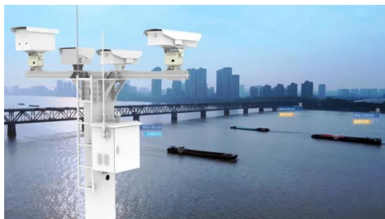
内河监管应用·水上智能卡口系统

公司充分利用三维激光扫描技术高效率、高精度的独特优势与特点，成功应用于周界安防、内河监管及变电站安全防范等场景中，并形成了自有的技术创新成果，如三维激光哨兵系统、水上智能卡口系统、桥梁安全预警系统等。