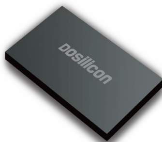
图：公司 MCP 产品