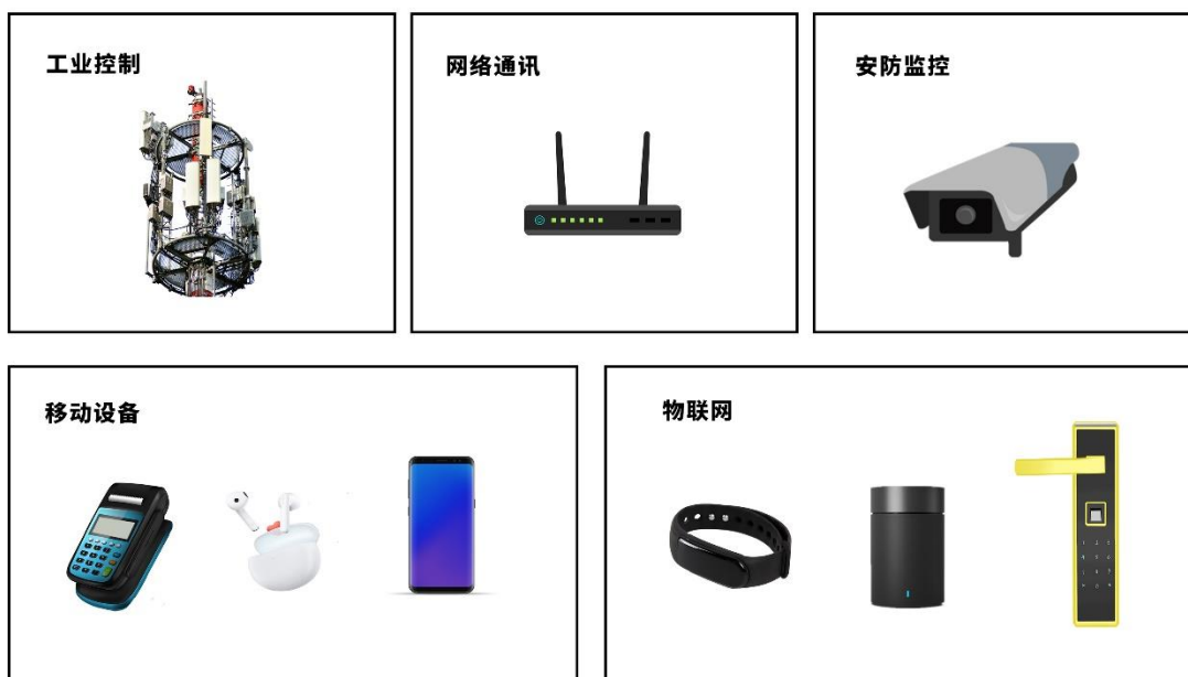
图：公司产品应用示例