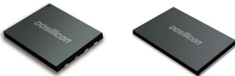
图：公司 NAND Flash 产品

公司 NAND Flash 产品核心技术优势明显，尤其是 SPI NAND Flash，该产品可提供 3.3V /1.8V 两种电压，具备 WSON、BGA 多种封装形式，公司采用了业内领先的单颗集成技术，将存储阵列、ECC 模块与接口模块统一集成在同一芯片内，有效节约了芯片面积，降低了产品成本，提高了公司产品的市场竞争力。凭借高可靠性被广泛应用于通讯设备、安防监控、可穿戴设备及移动终端等领域，通过了联发科、瑞芯微、国科微、博通等行业内主流平台厂商的认证。