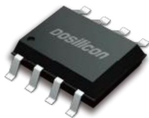
图：公司 NOR Flash 产品

公司自主设计的 SPI NOR Flash 存储容量覆盖 64Mb 至 1Gb，支持 Single/Dual/Quad SPI 和 QPI 四种指令模式、DTR 传输模式和多种封装方式。普遍应用于网络通信、可穿戴设备、移动终端等领域。