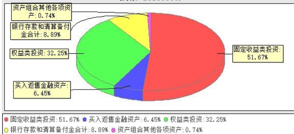
华宝新机遇灵活配置混合型证券投资基金(LOF)投资组合资产配置图表(数据截止日期: 20230630)