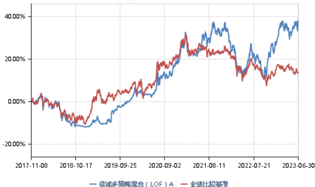
信诚多策略混合 (LOF) A