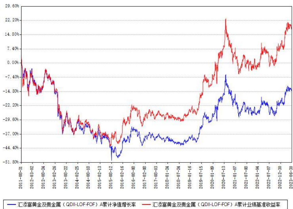
汇添富黄金及贵金属（QDII-LOF-FOF）A累计净值增长率与同期业绩基准收益率对比图

2、自基金合同生效以来基金累计净值增长率变动及其与同期业绩比较基准收益率变动的比较图