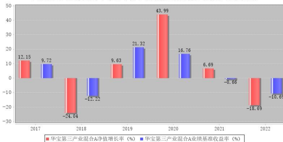
华宝第三产业混合A每年净值增长率与同期业绩比较基准收益率的对比图