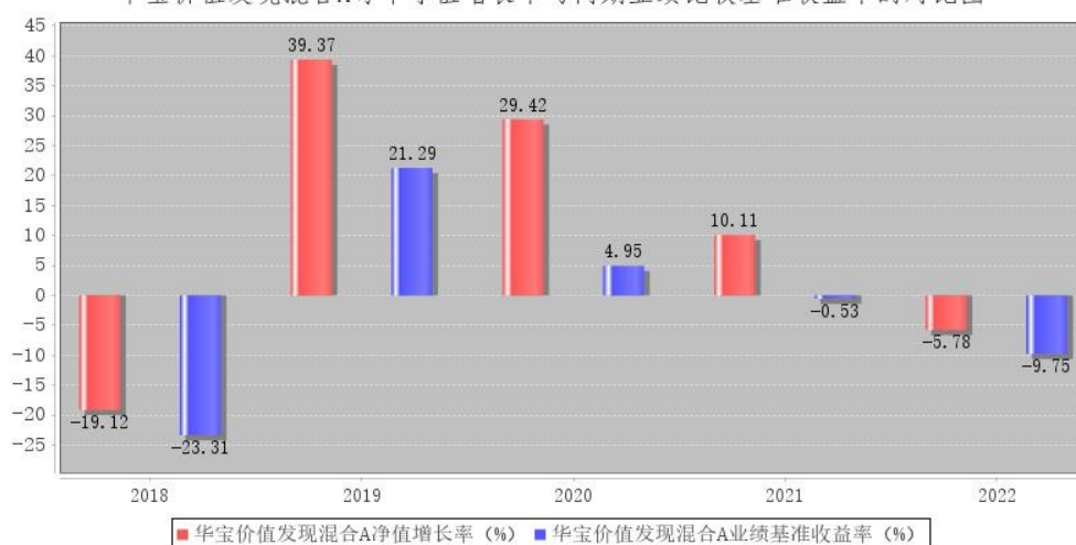
华宝价值发现混合A每年净值增长率与同期业绩比较基准收益率的对比图