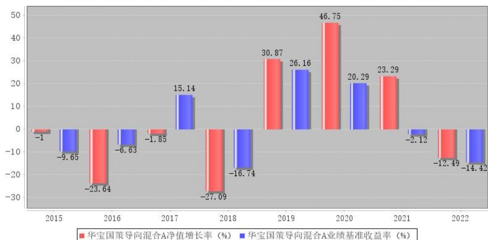
华宝国策导向混合A每年净值增长率与同期业绩比较基准收益率的对比图