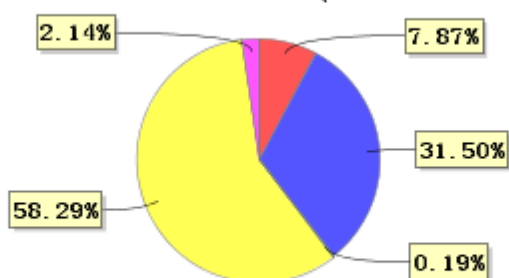
投资组合资产配置图表 (2022年9月30日)