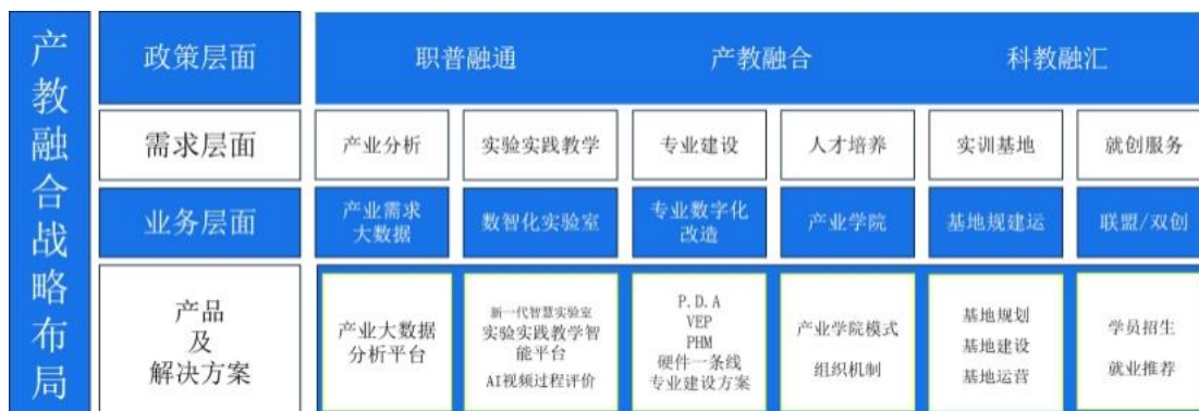
产教融合战略布局全景图

向，在新工科建设的背景下面向高等院校、职业院校提供新业态工程教育的新型实验实践实训产品及服务。