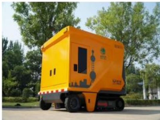
小型化履带式箱变车