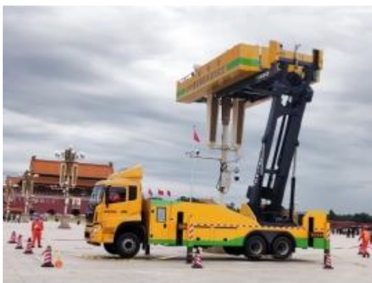
第五代华灯检修车

性及涉水、爬坡、自动转向等问题；轻量化车身，实现了整车小型化、轻量化、车内配电设备的安全运行及全天候作业，有效地解决了城市地下配电站所及狭窄道路空间的不停电作业，并大大提升作业效率和安全性能。