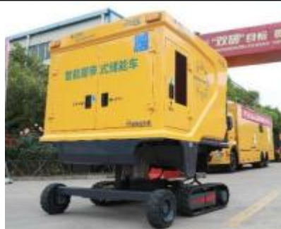
智能履带式储能车