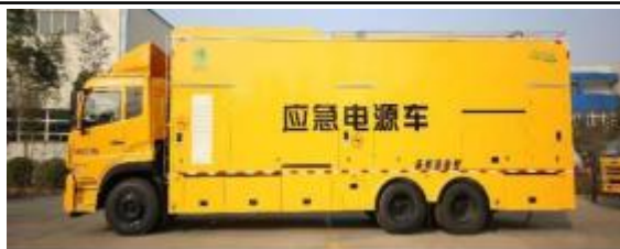
混合 UPS 不间断电源车