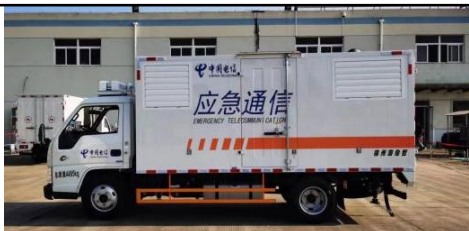
50-75kW 应急电源车（通讯行业使用较多）

主要介绍：本车型采用 5-10 吨专用汽车底盘上加装特制静音车厢，车厢内可配备 50-200kW 发电机组、控制柜、燃油箱、电缆及其卷盘等。主要适用于电力、通信、市政等应急供电保障作业工况，可快速对抢修抢建设施设备进行临时供电作业，单次加油作业时长可达 8 小时。