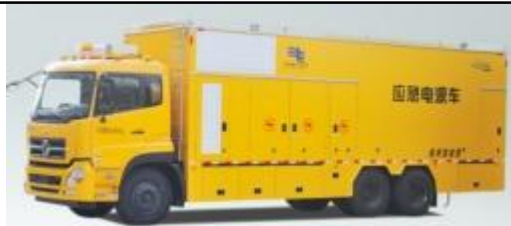
纯 UPS 不间断电源车 300kVA_U300

本车型为自主研发的高静音型电源车；主要适用于电力、通信、市政等应急供电保障作业工况；本车是为了满足重要场所重大活动高规格保电要求，保障重要负荷的高可靠性、高安全性不间断供电的移动 UPS 电源系统。系统是由以下部分组成：发电机组（选配）、UPS 电源（含 ATS 交流屏及电池开关柜、蓄电池、冷却系统等）、车辆底盘、箱体及监控系统等。