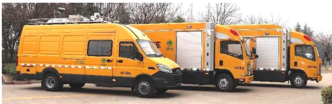
不停电旁路作业系统

主要介绍：旁路作业系统包括移动箱变车、环网柜车、旁路布缆车、开关车等组成，车辆采用专用二类载货汽车底盘上加装车厢，车内配备变电系统、环网柜、旁路作业设备、接地系统、照明系统以及其他辅助设备构成，具有耐候性强、操作简单、使用安全的特点。主要用于不停电检修配网线路及相关设备。