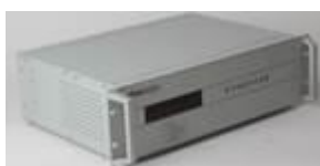
车号地面识别设备