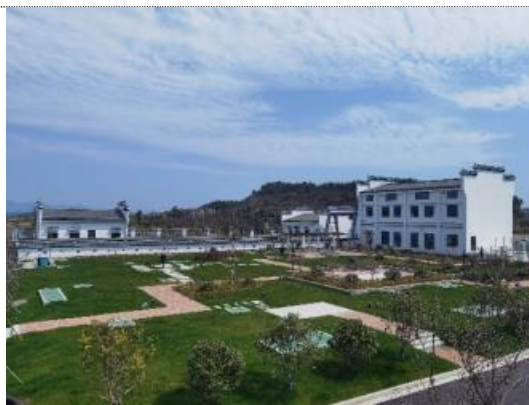
九江市武宁县生活污水处理项目（2万吨/天）