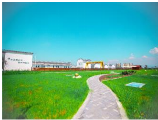
安徽望江污水处理厂项目扩建工程（5万吨/天）