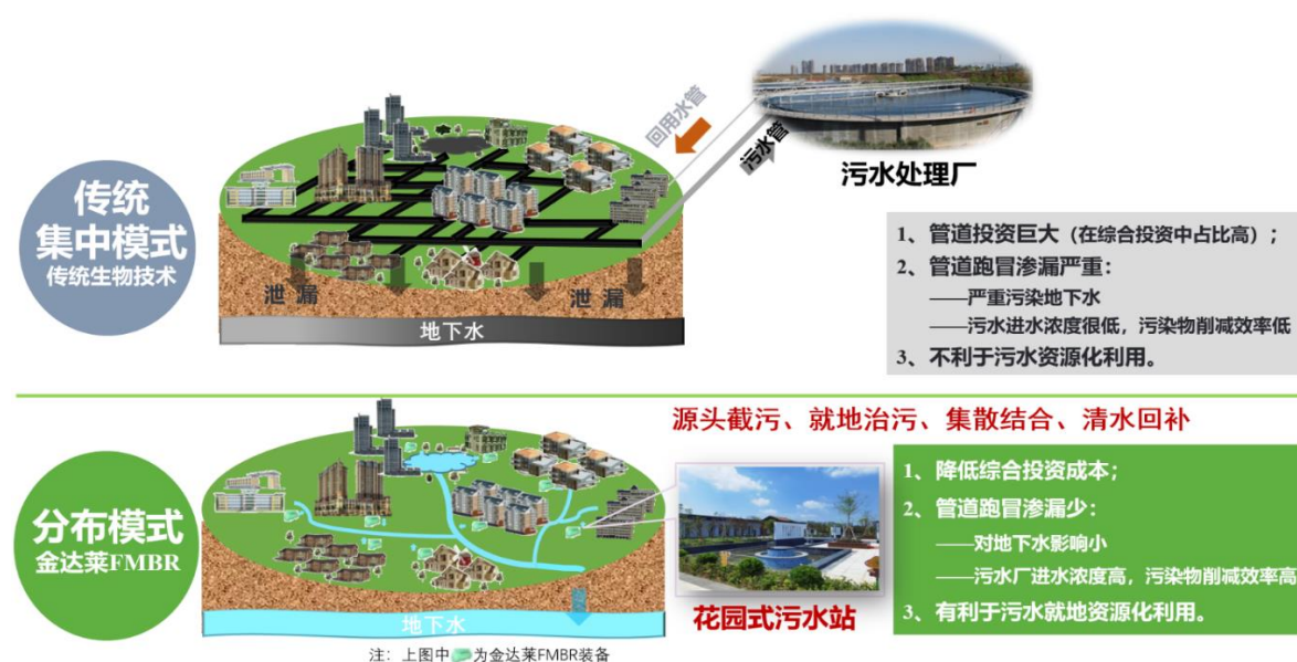
图为金达莱分布式治水模式与传统集中治水模式的对比情况