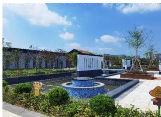
南昌市新建城地下生态水厂（2 万吨/天）