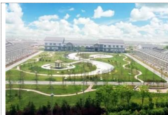
连云港市新城污水处理厂（总规模 13 万吨/天）

基于自身水污染治理装备在村镇污水处理等领域积累的口碑，依托核心技术优势，公司实施的中大型项目具有集成度高、水质好、占地小、建设周期短、综合成本低等特点，公司逐步将 FMBR 工艺应用于市政污水处理厂扩容或新建、工业废水处理等领域。同时，公司项目可建设为地下生态水厂、地上公园的智慧生态水厂模式，形成水城相融、人水相依的生态水景公园，在实际应用过程中，起到了良好的示范效果。