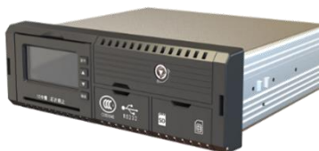
图 2 行驶记录仪

1. 智能网联产品：主要包括智能增强驾驶系统、车载联网终端和高级辅助驾驶系统的硬件，具体包括各类行驶记录仪、T-BOX、传感器及 ADAS 高级辅助驾驶系统等产品。