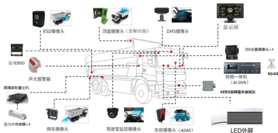
图 3 ADAS 高级辅助驾驶系统

行驶记录仪 ，满足 GB/T 19056-2021 国家标准，主要用于对重卡等车辆的行驶速度、时间、里程、位置等信息进行记录、存储，具有灾备存储功能，同时基于硬件设备采集传输的数据，通过内含驾驶行为专家库和不良驾驶模型的嵌入式软件模块分析处理，向使用者提供包括驾驶行为分析、最优驾驶指导（如油气耗管理）、全生命周期管理、“汽车后市场”服务（如商用车车险、车贷、物流等）、整车厂管理（如设计、研发、采购、生产、销售及售后等环节）等功能。