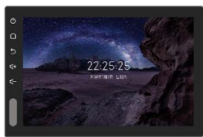
图 4 车载中控屏

2. 智能座舱产品： 主要包括人机交互终端，具体产品包括车载中控屏、汽车仪表及其他座舱产品。