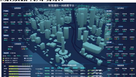
图 6 政务监管平台

4. 软件平台开发： 主要包括政务监管平台和主机厂车联网平台的开发、迭代、运维等服务，并探索数据利用场景。