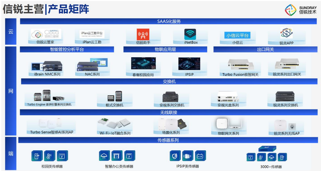
图 3：信锐网科产品矩阵

公司基础网络与物联网业务的经营主体为子公司信锐网科，其产品包括企业级无线、安视交换机、企业级物联网和面向中小企业的 SMB 数通组网产品，致力于为各行各业用户的数字化转型提供面向未来的网络联接产品及解决方案。其中，企业级无线业务提供全场景无线接入、无线网络安全、无线大数据分析等方案；安视交换机业务提供从接入、汇聚到核心等数字化升级改造的全场景有线安全接入方案；企业级物联网业务提供物联网校园、泛机房动环检测、智慧办公等智能化服务；SMB 数通组网产品提供组网“三件套（网关、交换机、无线 AP）”和“一平台（云平台）”的中小组网产品及服务。