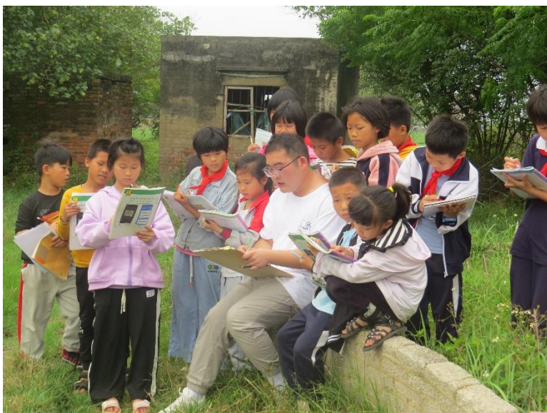
图 5：灯塔小学支教教师和孩子们户外共读

市和梅州市共 23 所乡村中小学，派遣艺术类支教教师 50 名，服务乡村学生 8,000 名以上，开展美术和音乐课程 9,408 节以上，授课课时达 6,272 小时以上，培养乡村学校艺术社团 24 个，为乡村学校美育教育带来了从 0 到 1 的转变，也为青年大学生们提供了深入乡村教育基层、深度参与乡村基层公益事业的机会。与此同时，基金会“暖暖繁星”公益助学项目覆盖广东省、云南省、湖南省等地，资助乡村经济困难学生共 104 名，包括孤儿、重大疾病家庭、残疾家庭、单亲家庭、突发变故家庭和低保家庭等，共计捐赠助学善款超 13 万元。除此之外，报告期内，深信服公益基金会向梅州市兴宁市中心小学捐赠了图书 1488 册；向梅州市兴宁市下堡中心小学捐赠了学生桌椅 250 套；并且联合公司爱心员工向湛江市和梅州市乡村地区经济困难的学生捐赠了 210 套文具用品。