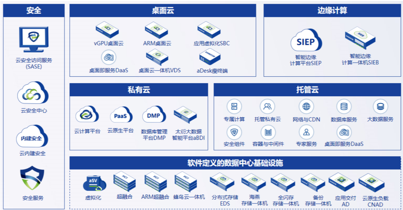
图 2：“信服云”架构全景图