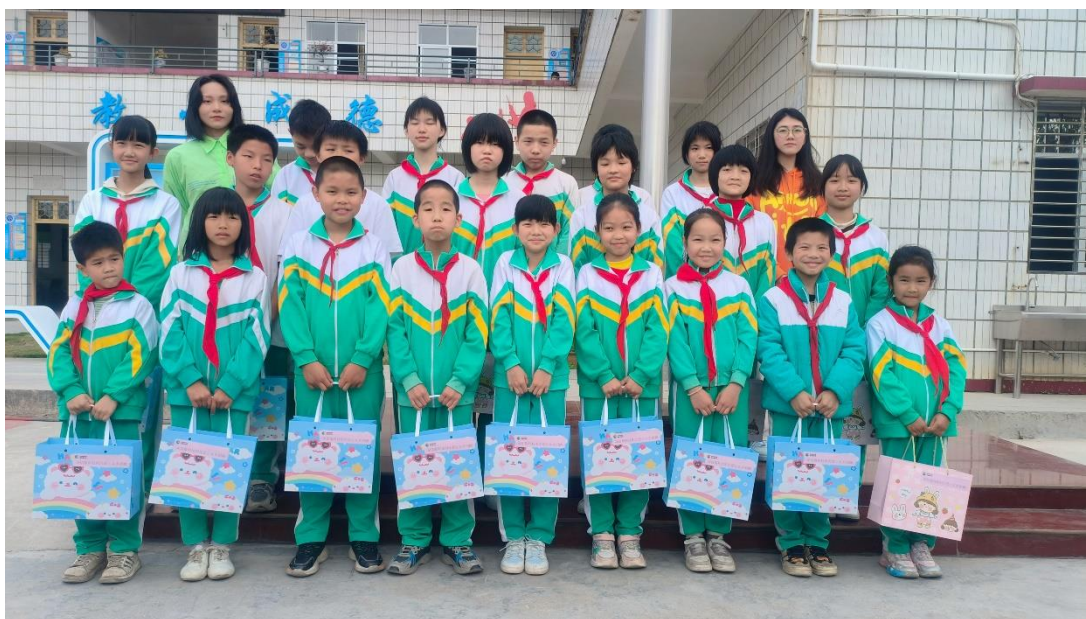
图 6：深信服公益基金会为经济困难学生送去文具礼盒