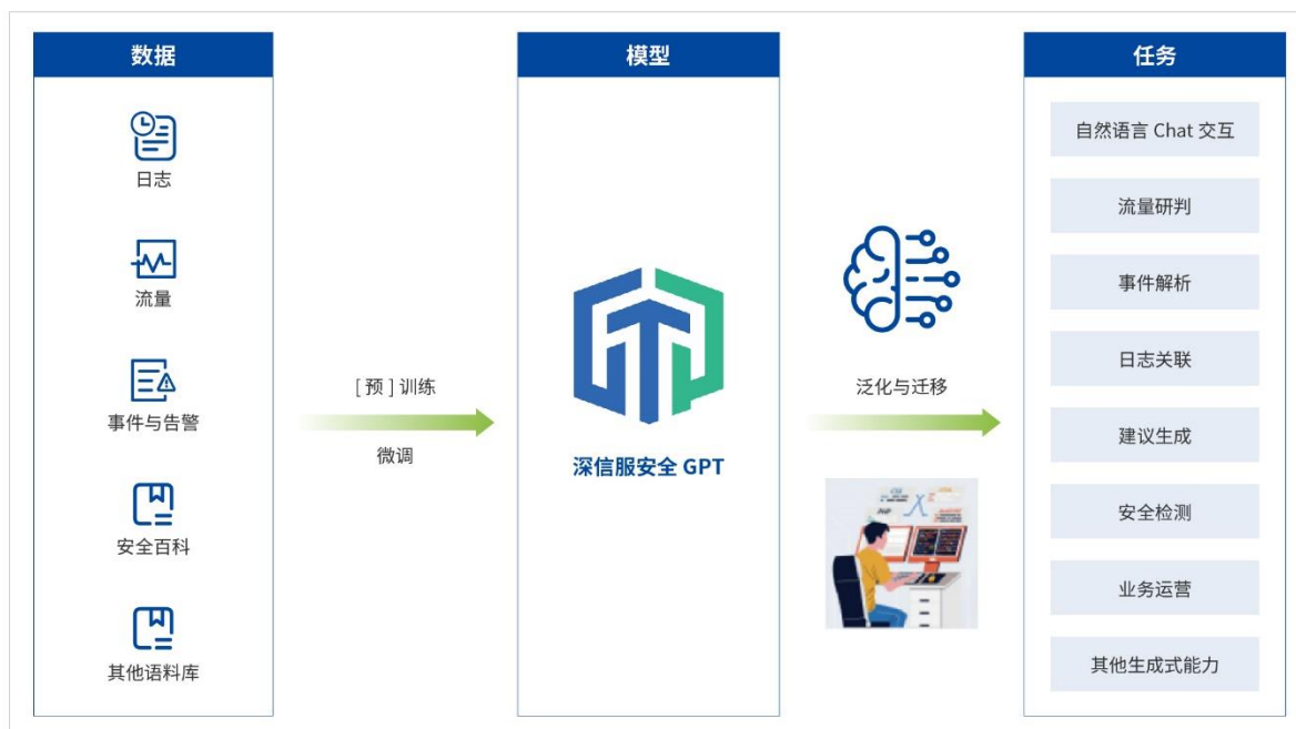
图 4：深信服安全 GPT 模型

安全 GPT： 报告期内，公司公开演示了国内第一款企业级安全大语言模型——安全 GPT。安全 GPT 是公司利用多年安全领域 AI 研发积累的高质量数据、算力、人才优势，基于多款开源基础大模型训练得到的垂直领域大模型。用户利用自然语言与安全 GPT 进行交互，可快速进行安全态势研判、攻击分析溯源、影响面调查、漏洞分析管理等安全运营操作，并显著提升高混淆攻击的识别研判能力，提升安全运营效率，提升面对攻击威胁的发现和响应速度，同时降低安全运营人员能力要求。