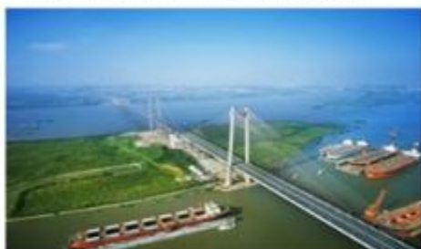
图例：珠江黄埔大桥