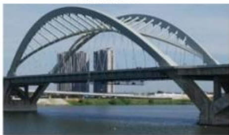
图例：鹰潭市余信贵大桥