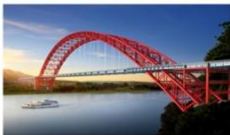
图例：四川犍为岷江大桥