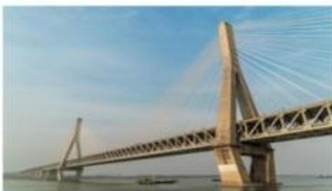
图例：天兴洲长江大桥