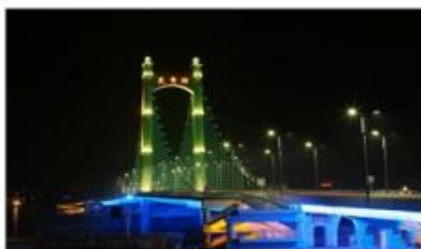
图例：天水市天秀桥