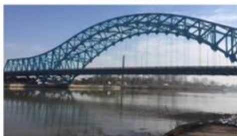
图例：泗阳城子河公路大桥