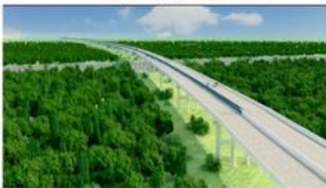
图例：江北东高速公路