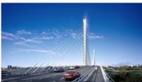
图例：上海泖港大桥