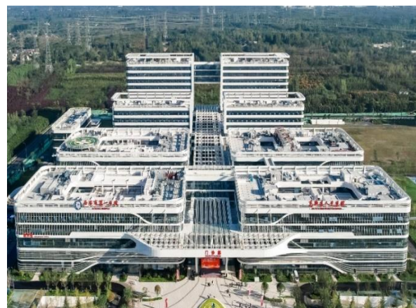
西安高新区医疗产业园项目

夯实根基，项目管理持续优化。 制订《项目履约品质综合评价管理办法》，从工期管理、技术质量管理、安全管理、文明施工及环境保护管理、现场 CI 形象管理、客户满意度等维度科学评价，全方面提升项目基础管理和履约能力；修订《施工现场临时设施管理标准》，以标准促规范、用标准抓落实，控制临设投入规模和标准，全面提升项目标准化、精细化、绿色化管理水平；组织项目参加省市级观摩样板工地交流，通过督导服务、检查评比和交流学习，西安地铁 10 号线、未来之瞳、西安国际足球中心等一批重点信誉工程按期或超前完成目标，受到省市各级领导和业主的高度赞誉；陕西省住房和城乡建设厅授予 2022 年第二、三批省级文明工地称号 238 个，其中公司及子公司创建 85 个，占全省的 35.71%。