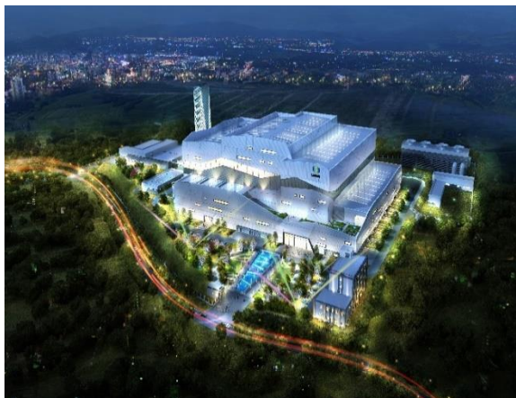
西安市灞桥区生活垃圾无害化处理热电项目

/80 万千瓦时储能一体化项目成功并网发电，配套储能规模达 200MW/800MWh，是目前国内最大的电化学储能电站；装配式建筑快速发展，在陕西西咸新区、铜川、安康、延安等地相继完成产业布局，装配式混凝土建筑方面形成了涵盖剪力墙结构、框架结构、工业类、市政类、集成箱式房等产品的一整套关键技术体系，装配式钢结构工程的深化设计、预制加工、存储运输、现场安装、组织协调能力大幅提升，3 月陕西省住房城乡建设行业装配式工人培训基地落户陕建产投，填补了省内装配式工人培训领域空白；陕建十三建承建了陕西榆林定边 300MW 风电项目，混凝土塔筒管片已正式开工生产，分片施工能有效提高施工效率，降低工程成本。