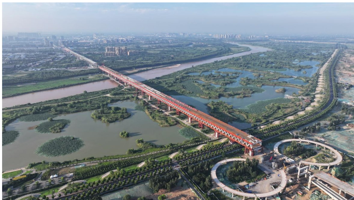
西安地铁 10 号线渭河公轨合建桥

研发和成果转化；混凝土四轮激光整平机器人、砂浆喷涂抹平机器人、管道全位置自动焊接机器人等智能装备走进项目，投入测试或应用阶段，智能建造水平有所提升。