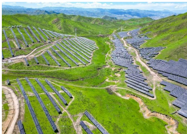
甘肃省合作市 40 兆瓦“牧光互补”集中式光伏项目