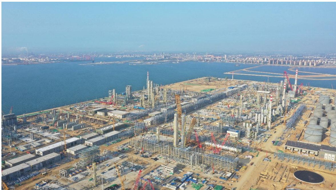
山东裕龙石化裕龙岛炼化一体化项目（一期）