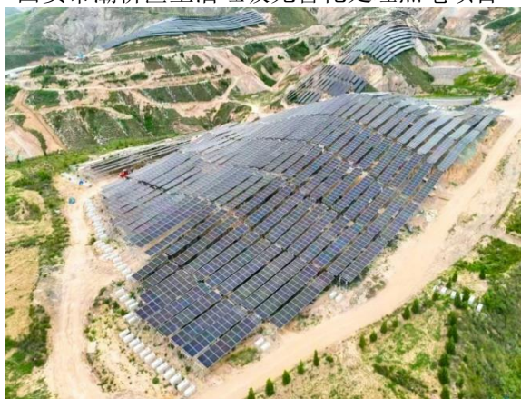
华能泾阳 200MW 光伏+生态治理发电项目