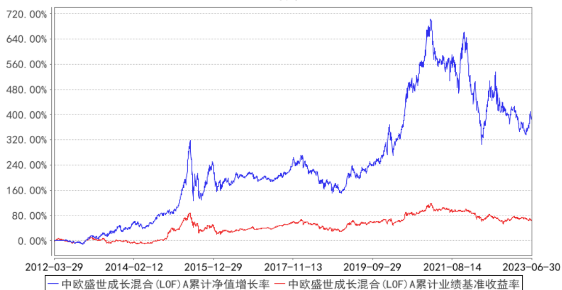
中欧盛世成长混合 (LOF) A 累计净值增长率与同期业绩比较基准收益率的历史走势对比图