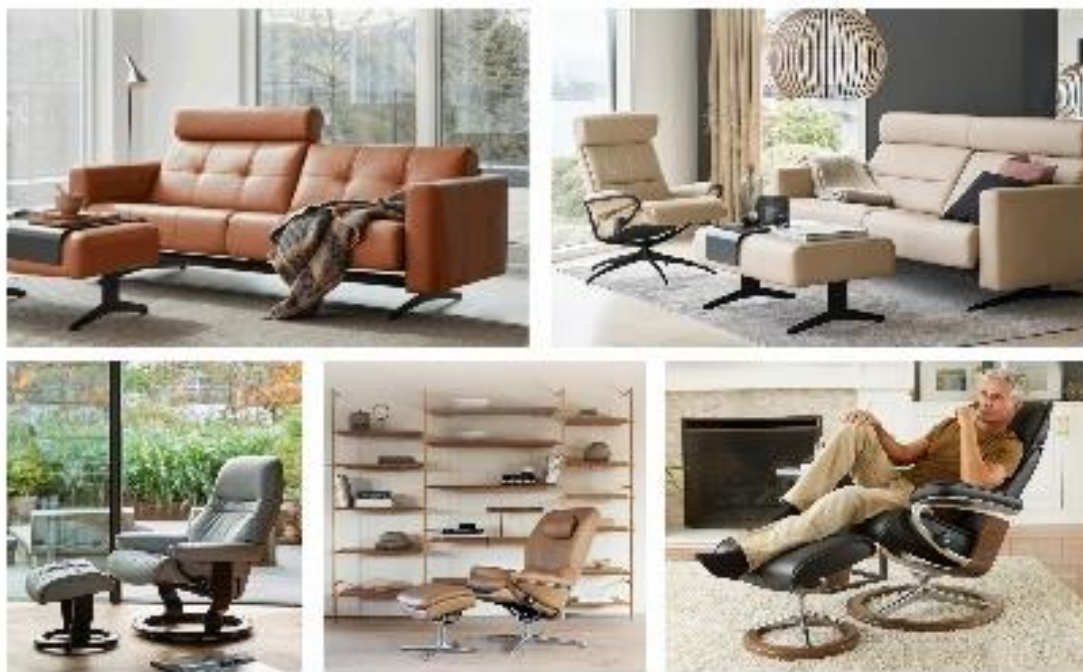
配图: Stressless 部分产品: 艾拉功能沙发、斯黛拉功能沙发、东京舒适椅、朝阳舒适椅、罗马舒适椅、Admiral 海军上将舒适椅

青睐,其低总价的特征帮助品牌在欧美地区吸引了更多的年轻消费者,帮助品牌优化消费者结构,并为舒适椅产品引流。