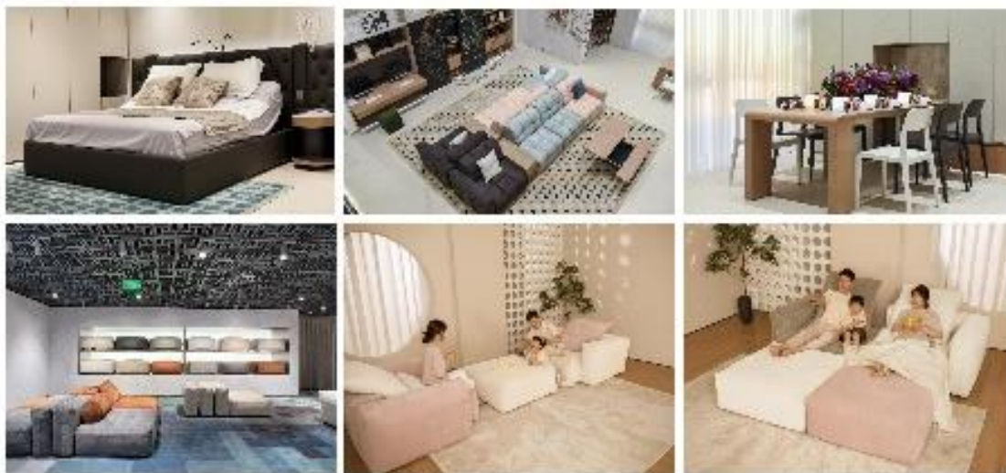
配图：2023 年曲美部分新品：曲美 B8 整家全案产品、曲美 Lab 墩墩沙发

报告期内，公司持续深化产品创新，一方面，通过“墩墩沙发”、“曲美 Lab 可变桌椅”等新产品，结合线上内容资产的建设，推动电商业务的增长，另一方面，以“2023 新 B8”、“河湾”、“集木”、“漾”等产品为抓手，结合线下渠道复苏的窗口期，推进店面形象升级与招商工作，2023 年上半年，曲美家居品牌经销商门店净增长 40 家，恢复良好的增长趋势。