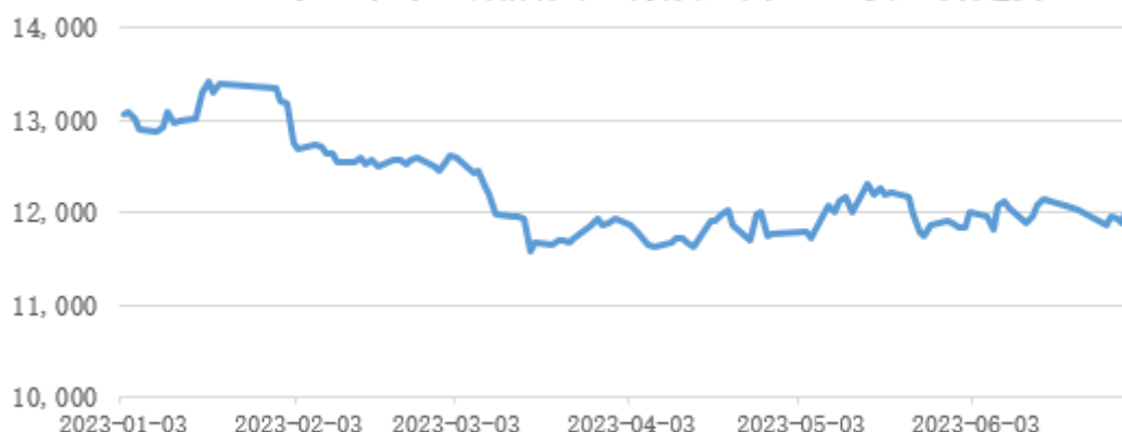
2023年上半年上期所天然橡胶主力合约收盘价走势