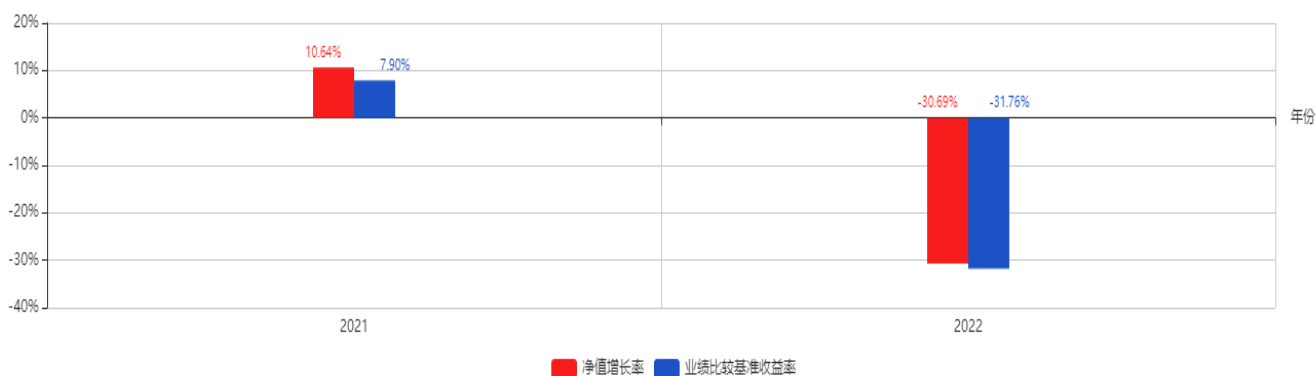
基金每年的净值增长率及与同期业绩比较基准的比较图