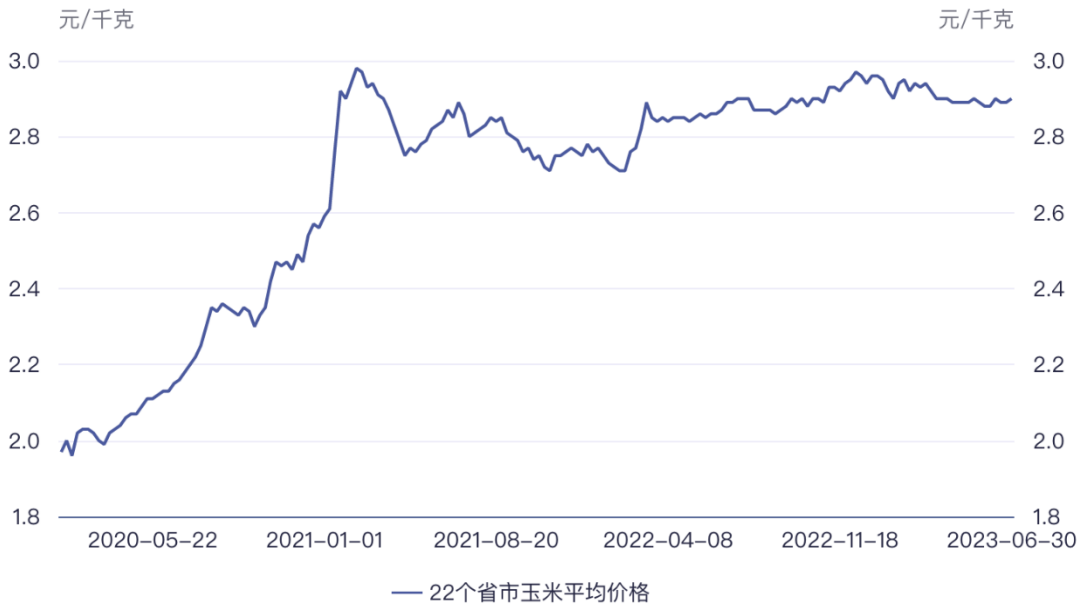
2020年至2023年6月我国玉米价格走势