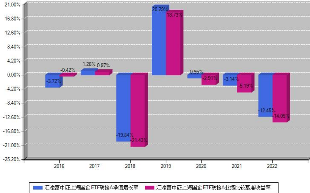
汇添富中证上海国企ETF联接A每年净值增长率与同期业绩基准收益率对比图

注：基金的过往业绩不代表未来表现。本《基金合同》生效之日为2016年09月18日，合同生效当年按实际存续期计算，不按整个自然年度进行折算。