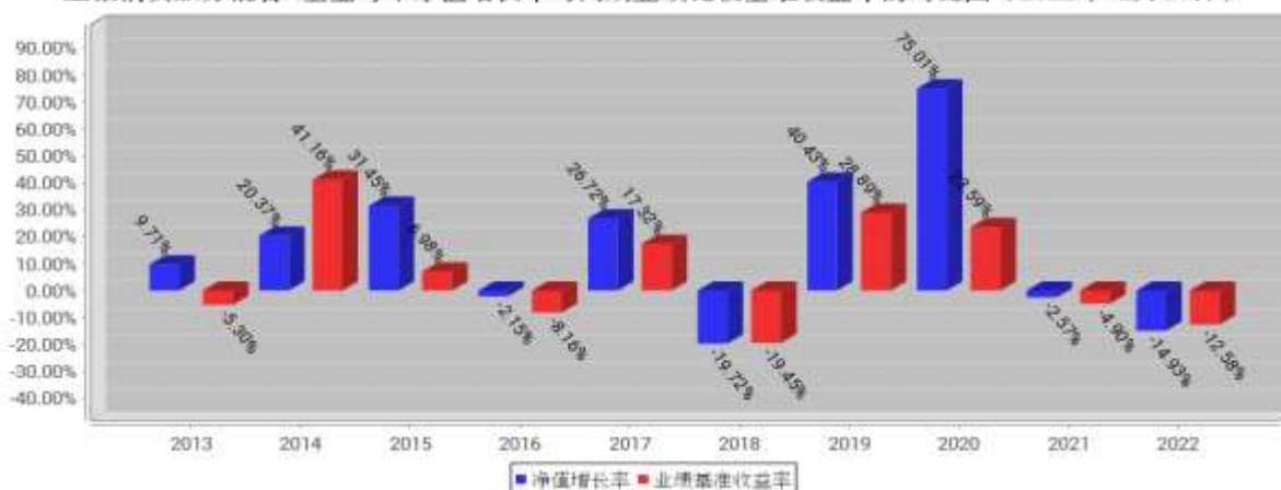
工银消费服务混合A基金每年净值增长率与同期业绩比较基准收益率的对比图（2022年12月31日）

注：1、本基金基金合同于2011年4月21日生效。合同生效当年不满完整自然年度的，按实际期限计算净值增长率。