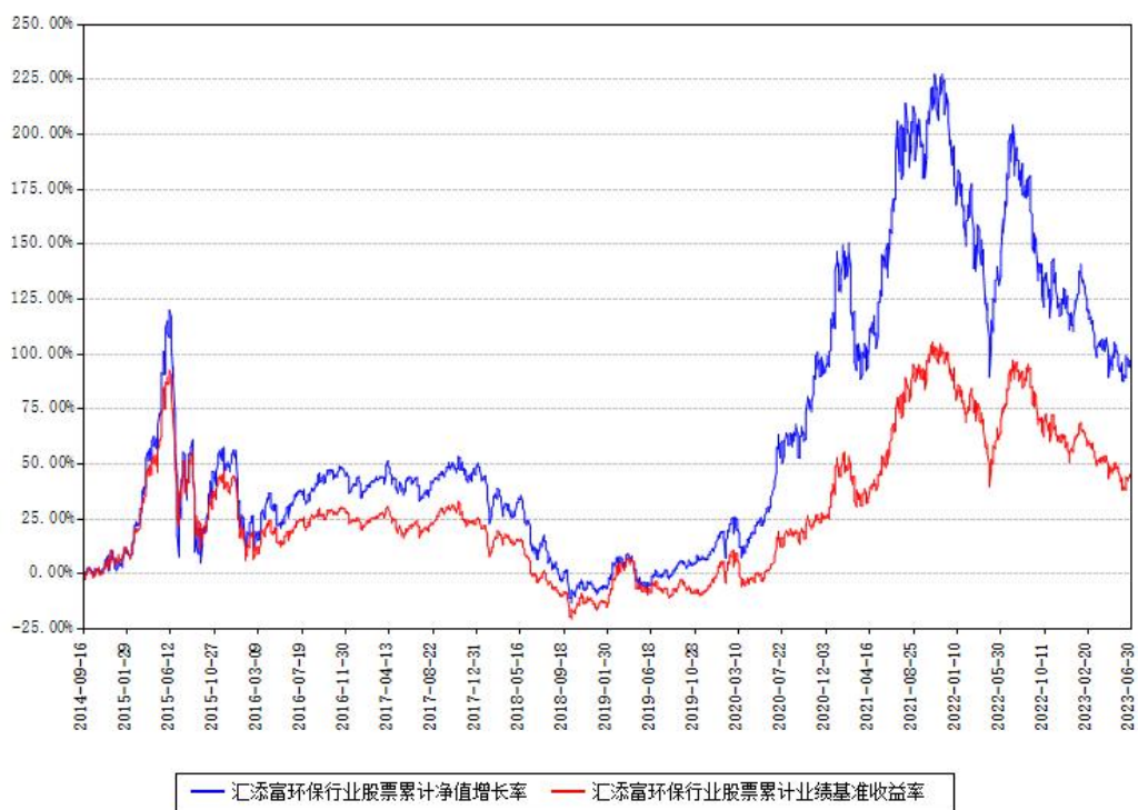
汇添富环保行业股票累计净值增长率与同期业绩基准收益率对比图