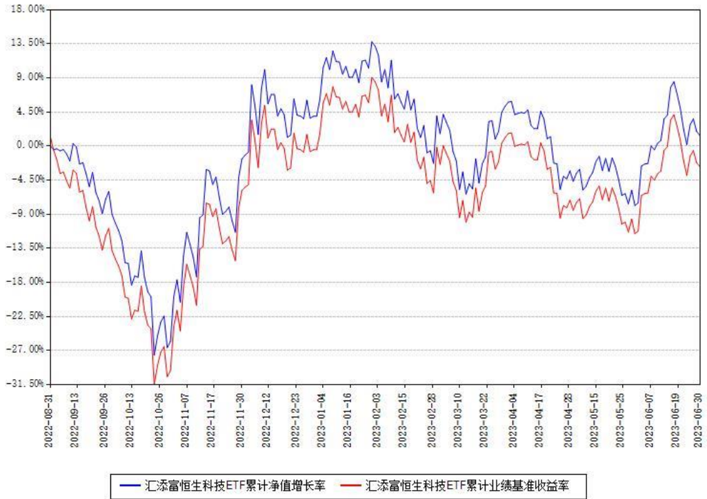
汇添富恒生科技ETF累计净值增长率与同期业绩基准收益率对比图